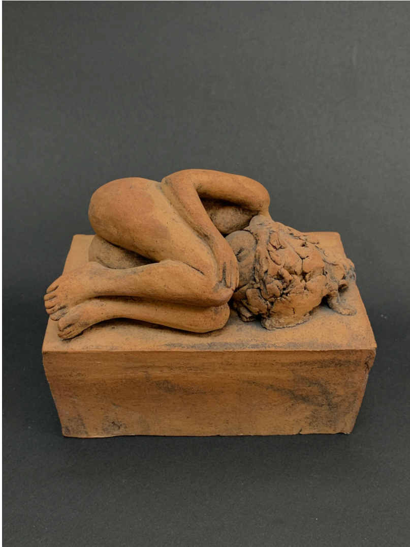
Petite endormie Grès et oxydes cuisson 1260°