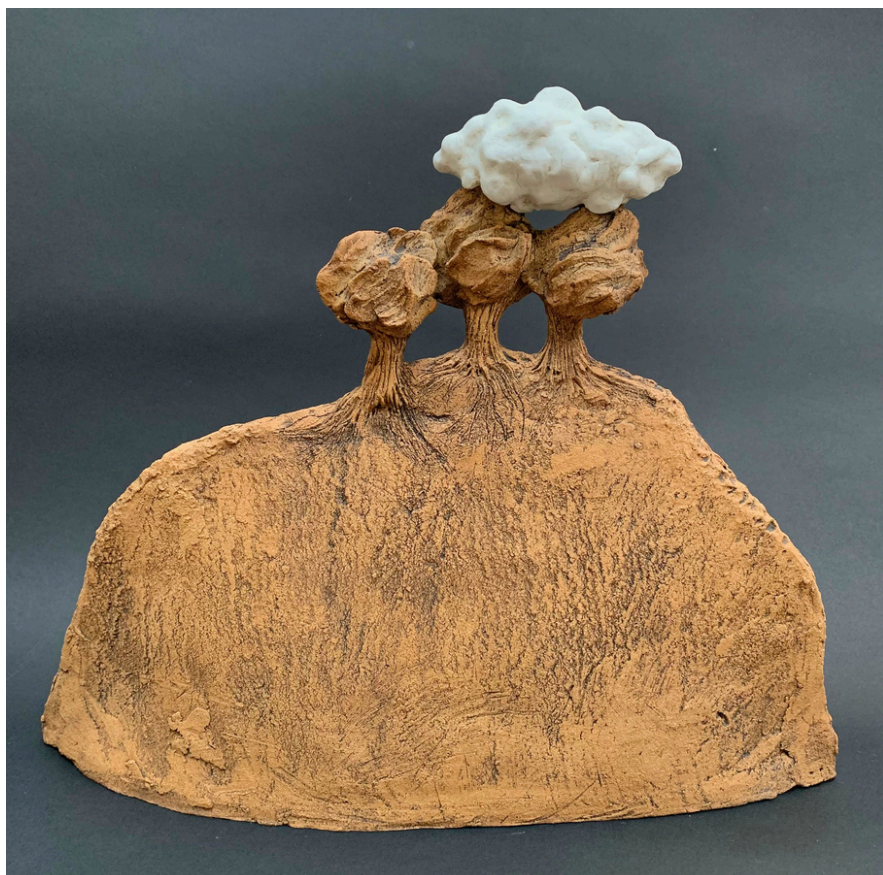
Paysage trois arbres et un nuage Grès, oxydes et jus de porcelaine cuisson 1260°