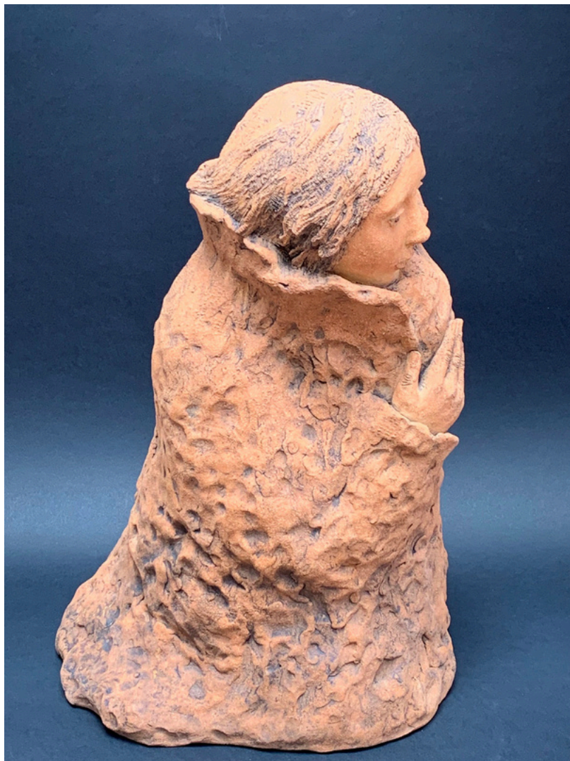
La main sur l'épaule Grès et oxydes cuisson 1260°