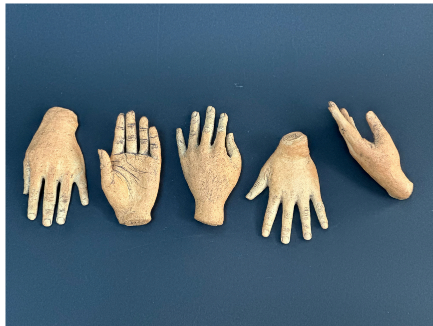
Série "Les mains " Grès et oxydes cuisson 1260°