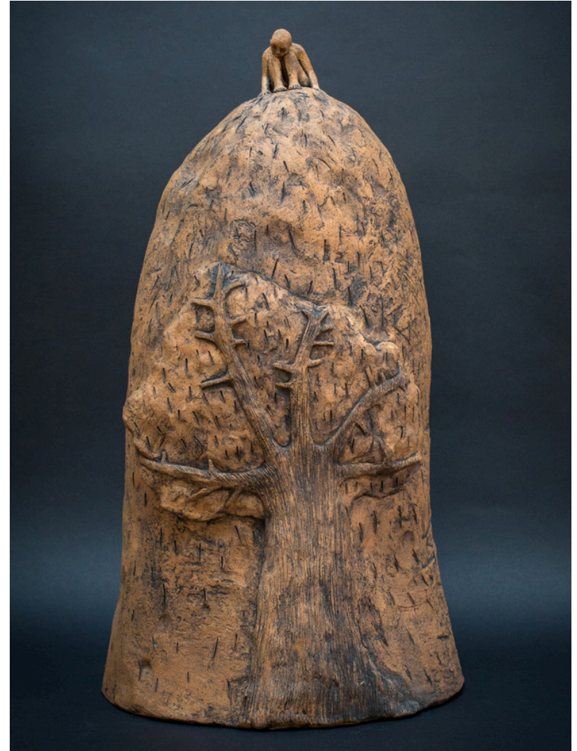
Toutes les larmes de mon cœur Grès et oxydes cuisson 1260°