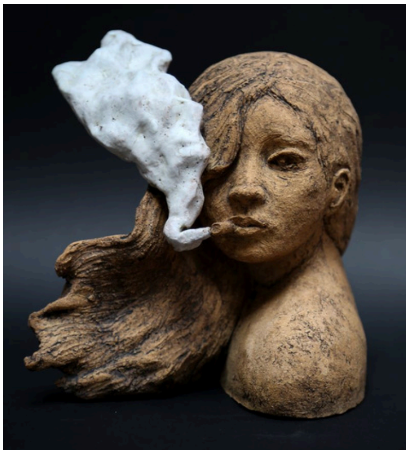
La fumeuse Grès et oxydes cuisson 1260°