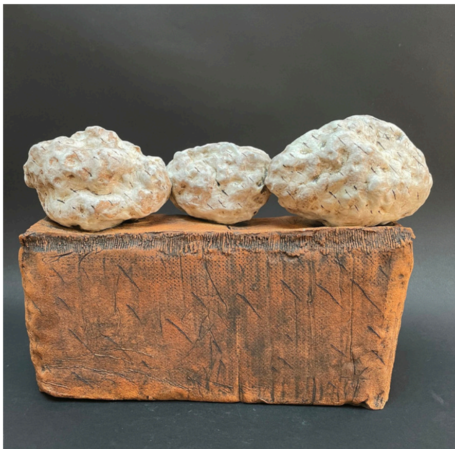
Paysage trois nuages Grès, oxydes et jus de porcelaine cuisson 1260°