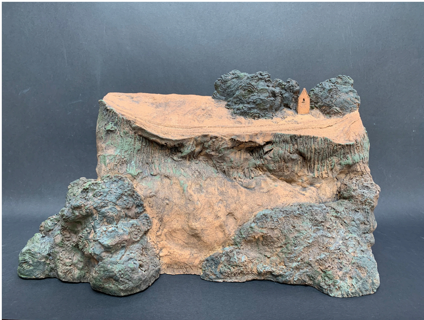
Paysage diptyque Grès et oxydes cuisson 1260°