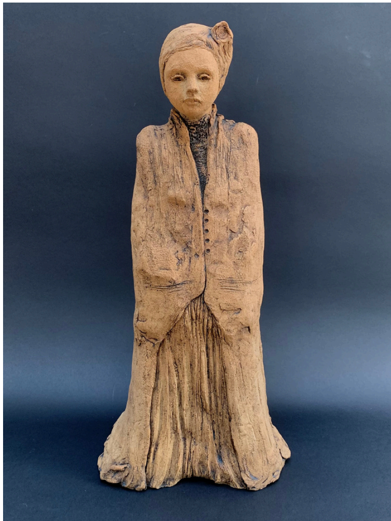
Femme nomade au bonnet à fleur Grès et oxydes cuisson 1260°