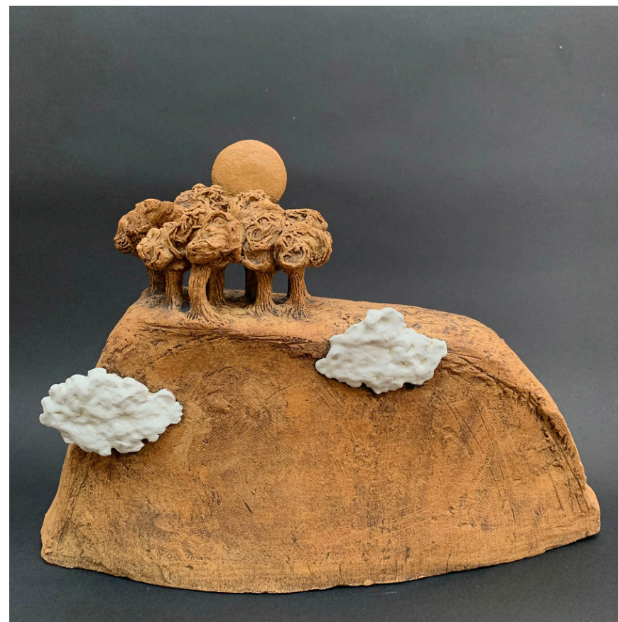
Paysage la lune et les nuages Grès, oxydes et jus de porcelaine cuisson 1260°