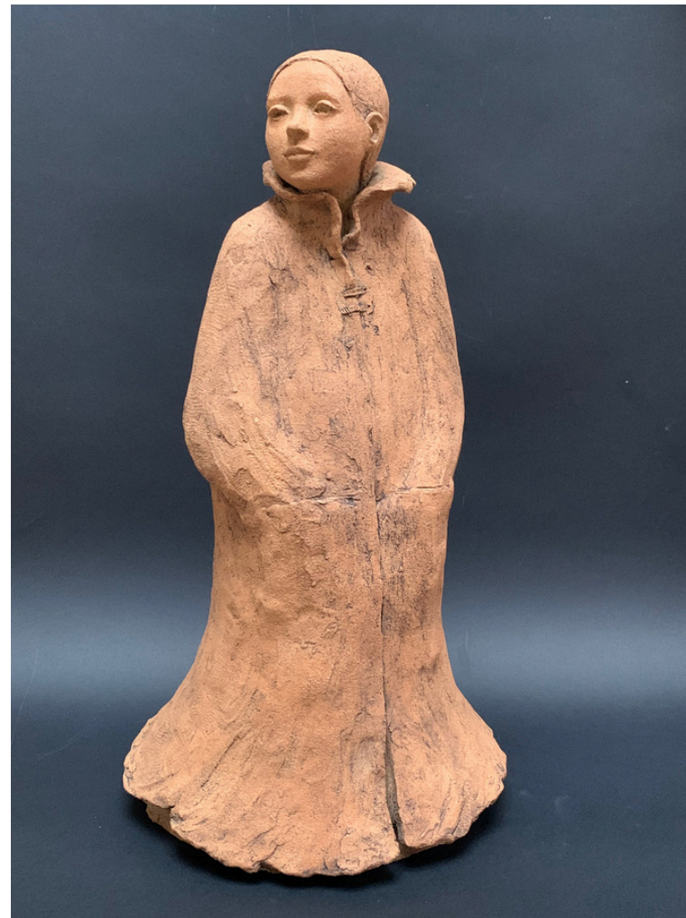
Le manteau Grès et oxydes cuisson 1260°