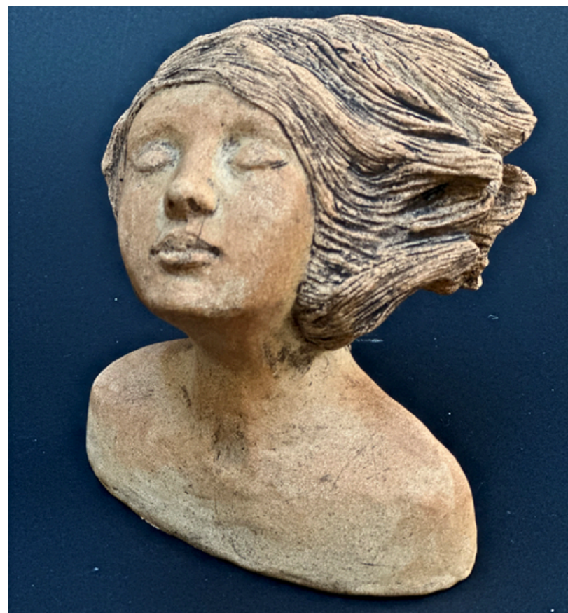
Petit buste cheveux au vent Grès et oxydes cuisson 1260°