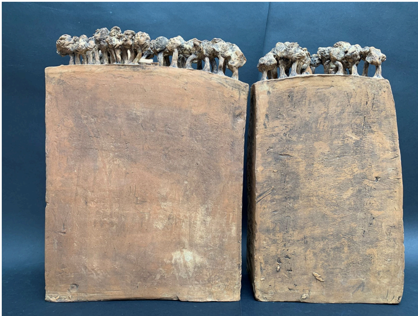
La falaise Grès et oxydes cuisson 1260°