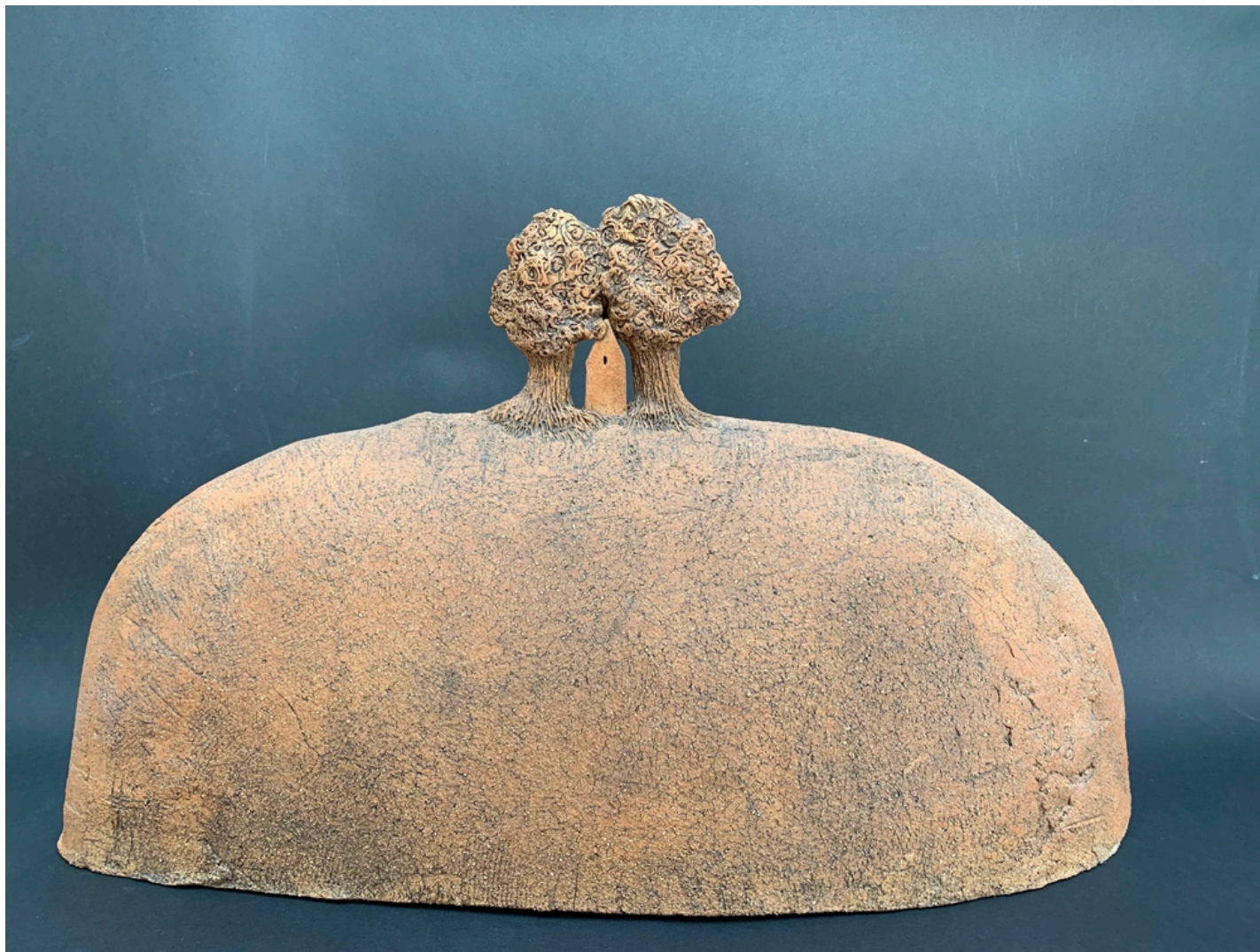
Paysage deux arbres et une maison Grès et oxydes cuisson 1260°