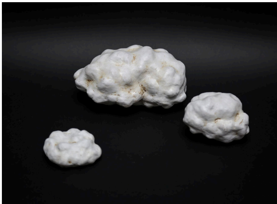
Série "nuages " Grès, oxydes et jus de porcelaine cuisson 1260°