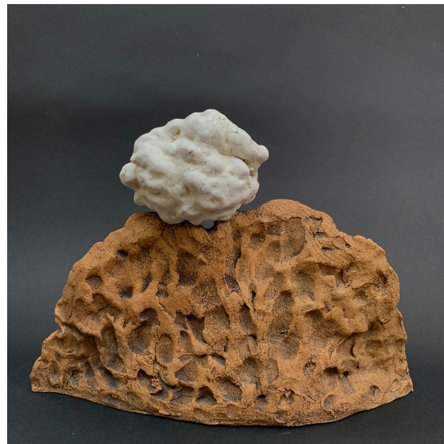
Petit paysage le nuage Grès, oxydes et jus de porcelaine cuisson 1260°