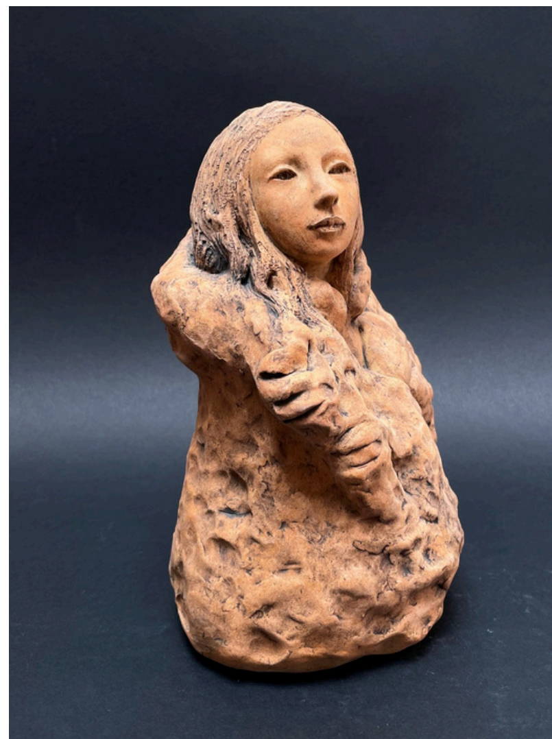
Le manteau de laine Grès et oxydes cuisson 1260°