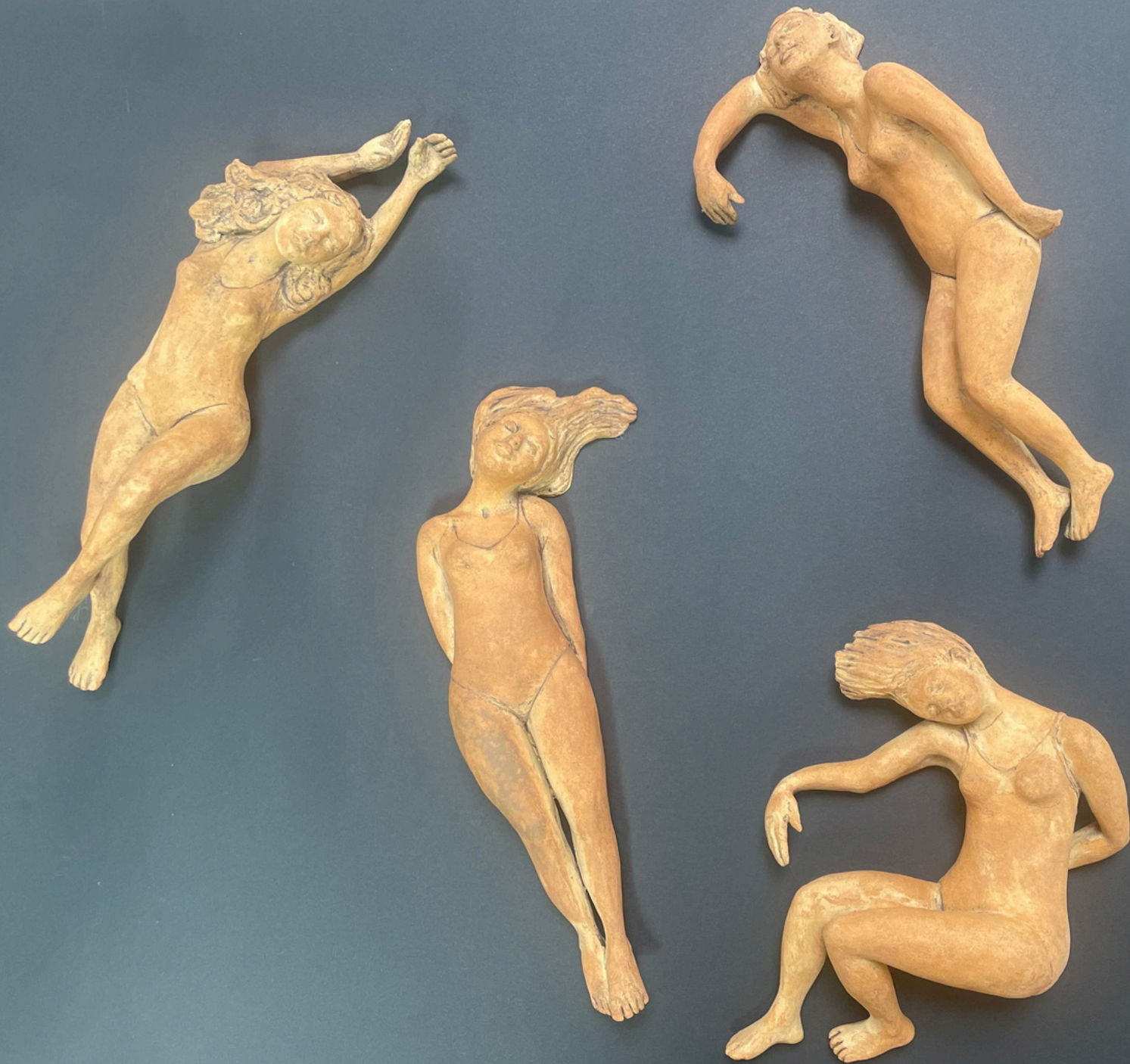
Nageuses Grès et oxydes cuisson 1260°